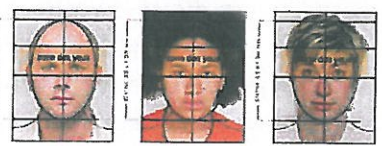
CONFORME À LA NORME ISO/IEC 19794-5 : 2005